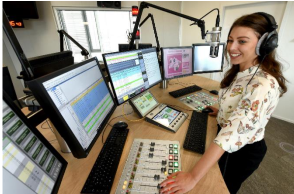
Neues Sendestudio mit DABiS800

Das alte Funkhaus ist einem neuen fünfstöckigen Gebäude mit grossen Glasflächen gewichen. Das neue Zuhause der WA-Mediengruppe in Hamm ist nach zwei Jahren Bauzeit gerade fertig geworden. Mit dem Einzug von Radio Lippe Welle Hamm ins „Penthouse“ in die vierte Etage sind auch die Bewohner komplett. Print, Online und Radio - alle Kollegen arbeiten in einem Haus, die Wege sind kürzer- und das Synergiepotential grösser geworden.